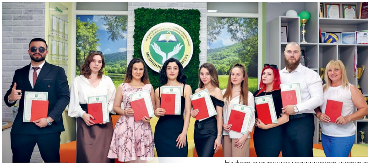
На фото выпускники медицинского института

Делясь планами на будущее, девушка призналась, что хочет продолжить обучение. Её главная цель – реализовать себя как педагога и стать настоящим профессионалом своего дела.